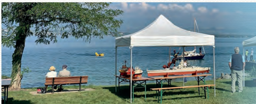
Les maquettes de bateau de Claude Paccard