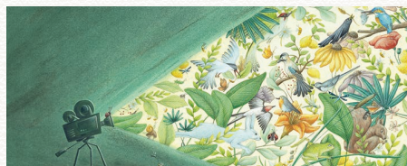
Illustration: Lucie Fiore